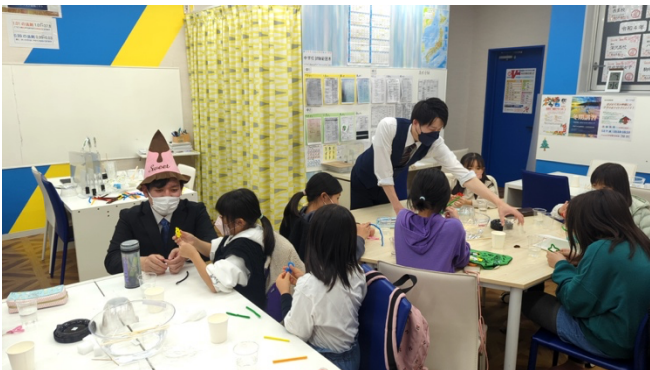
前回の理科実験教室、中目黒校での様子です。 みんな思考をめぐらせながら真剣に取り組んでいます。

その中でも重力による「 時空のゆがみ 」は、私たちの物理法則を使ってシンプルに説明できることで有名です。科学のドキュメンタリーでもよく再現されるこの仕組みを今回は現場で体験してもらおうと思います。